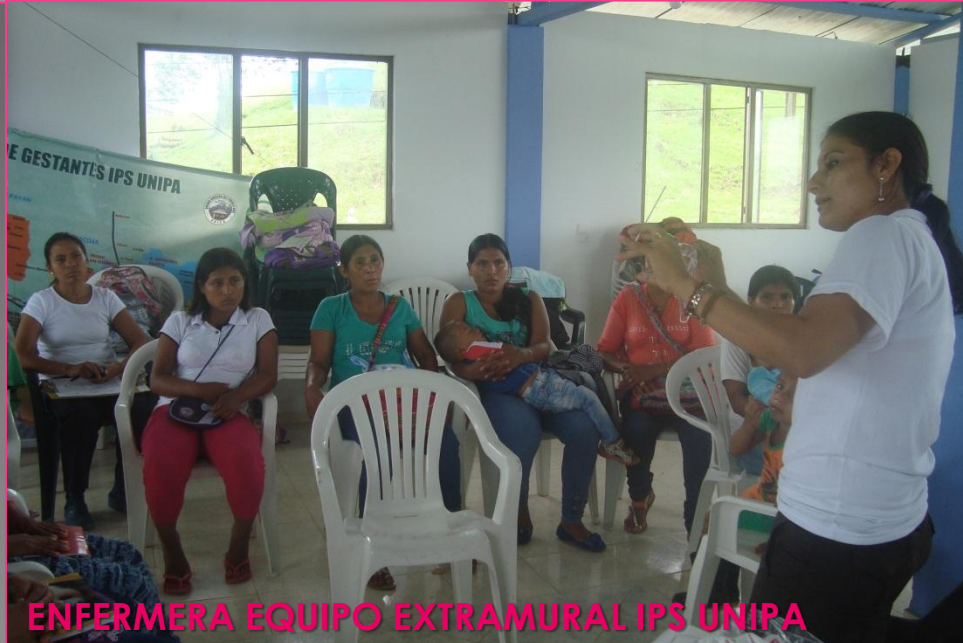
ENFERMERA EQUIPO EXTRAMURAL IPS UNIPA