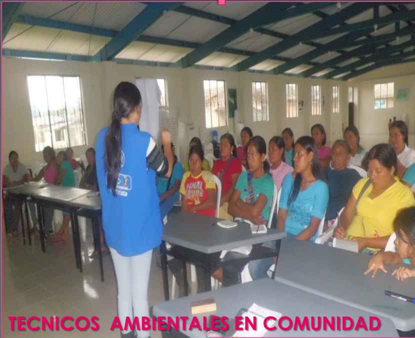
TECNICOS AMBIENTALES EN COMUNIDAD