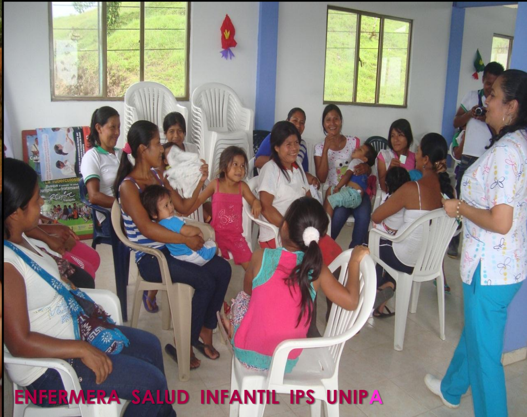
LUDICAS EN LA COMUNIDAD